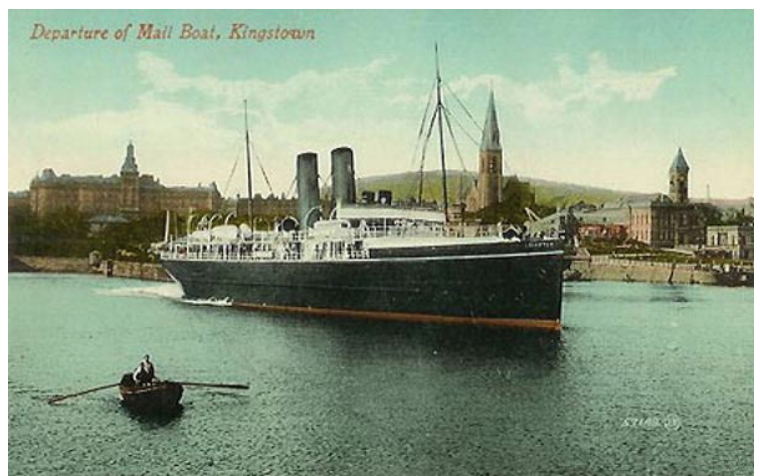
(Cárta poist an R.M.S. Leinster, 1897)

Ba leis an gComhlucht Paicéad Gaile Chathair Bhaile Átha Cliath (The City of Dublin Steam Packet Company) an R.M.S. Leinster agus bhí sí á reáchtáil acu chun seirbhís poist agus paisinéirí a chur ar fáil ó Bhaile Átha Cliath go Caergybi (Holyhead) na Breataine Bige. Bhí ceithre long sa loingear agus tugadh ainmneacha na cúigí Éireannacha orthu. Ar maidin an 10 Deireadh Fómhair 1918, d'fhág an R.M.S. Leinster Dún Laoghaire (ar a tugadh Kingstown ag an am) agus gar do 800 duine ar bord. Ba bhaill den arm: