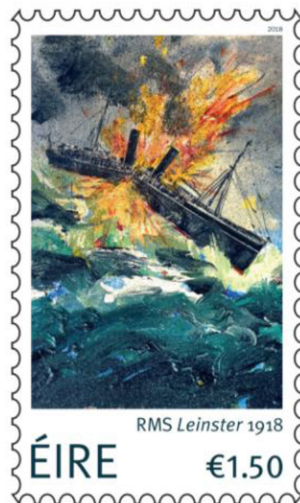
Stampa Cuimhneacháin eisithe ag An bPost sa bhliain 2018.